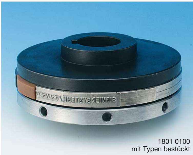
1801 0100 mit Typen bestückt