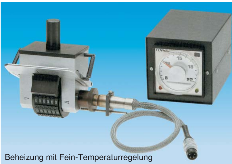
Beheizung mit Fein-Temperaturregelung