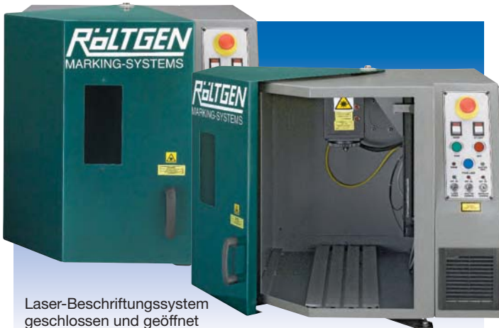
Laser-Beschriftungssystem geschlossen und geöffnet